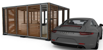
Bureau permanent ou temporaire