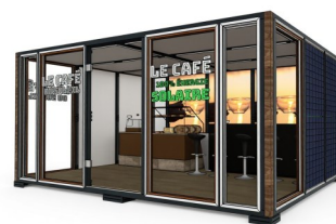
Café, street food , etc. ....